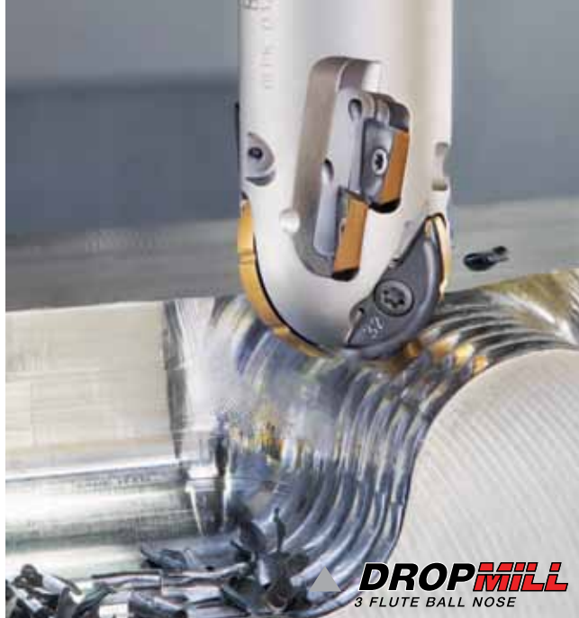
Рис. 2. Длиннокромочная фреза серии DROPMILL 3

Длиннокромочные фрезы широко представлены в линии изделий ISCAR. Они отличаются по конструкции корпуса (цельный или сборный), способу установки на станке (хвостовые и насадные) и методу закрепления пластин (тангенциальный и радиальный). Работая в тяжёлых режимах, такой инструмент испытывает значительные механические и тепловые нагрузки. Интенсивный съём материала диктует необходимость обеспечения надлежащего объёма стружечного кармана фрезы. Увеличение объёма приемлемо до определённого предела, за которым следует ощутимое снижение прочности и жёсткости корпуса. Для достижения оптимального соотношения характеристик поперечного сечения корпуса ISCAR разработал ряд длиннокромочных фрез, несущих СМП со стружкоразделяющей геометрией, преобразующей широкую стружку в малые сегменты. В результате снижаются нагрузки на инструмент и повышается его виброустойчивость.