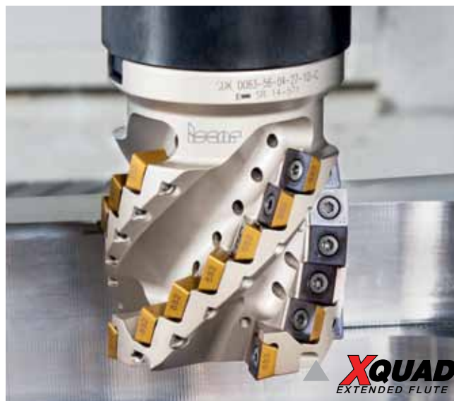
Рис. 3. Длиннокромочная фреза XQUAD

Активно применяются длиннокромочные фрезы в железнодорожном машиностроении. Значительная часть из них приходится на специализированные конструкции для одновременной обработки сразу нескольких поверхностей детали.