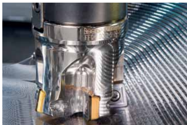
Рис. 4. Фреза с высокой подачей на зуб

Мир фрез для высоких подач ISCAR по-настоящему богат: дюжина различных семейств в диапазоне диаметров до 160 мм для обработки основных групп конструкционных материалов отвечает запросам самого взыскательного потребителя.