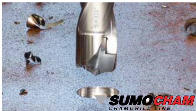
Рис. 5. Сверло SUMOCHAM

В станочном парке предприятий, производящих крупногабаритные детали, зачастую доминирует мощное, но тихоходное металлорежущее оборудование, не позволяющее реализовать фрезерование с ВП. Для таких предприятий ISCAR предлагает иное решение – торцевые фрезы типа MF (moderate feed – умеренная подача), характеризующиеся рабочей подачей на зуб, уступающей ВП, но превышающей обычные. Главный угол в плане у фрез MF больше, чем у фрез с ВП, соответственно, и максимальная глубина резания увеличена. Отмеченные особенности позволяют успешно применять такие торцевые фрезы MF на тяжёлых станках с низкоскоростным приводом подачи.