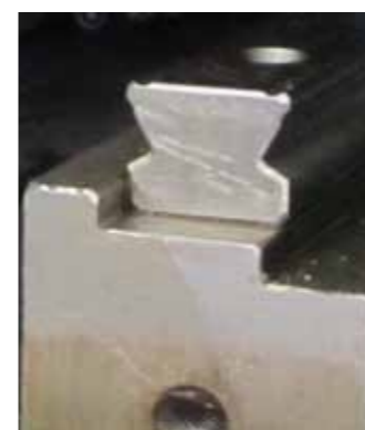
Явно шлифованная поверхность с установленной линейной направляющей японского станка «не-Содик». Станок потерял точность всего за 4 года (фото сделано по время ремонта)

Но опаснее, когда на шлифованную чугунную плоскость с избыточной волнистостью ставится линейная направляющая, по которой ездят каретки стола или колонны. Под нагрузкой через годы направляющая на разных участках смещается по длине различно, превращаясь в криволинейную! В результате станок с достаточной точностью после запуска неотвратимо быстро эту точность теряет! Печально, но это уже и не гарантийный случай! Продавец всегда может сослаться на недопустимые условия эксплуатации и надумать массы других «уважительных» причин. И это неизбежно случается, если посадочные плоскости на чугунной станине не ШАБРИЛИ, а ШЛИФОВАЛИ!