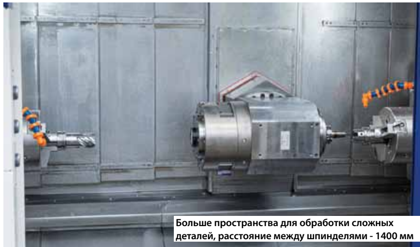
Больше пространства для обработки сложных деталей, расстояние между шпинделями - 1400 мм

Теперь в стандартную комплектацию станка входит новый помощник по управлению и выполнению производственных процессов – EMCONNECT . EMCONNECT – это цифровой помощник для комплексной интеграции пользовательских и системных приложений с целью управления станком и технологическим маршрутом. Поскольку последовательность операций ориентирована на пользователя и его требования, можно создавать более эффективные рабочие процессы, опираясь на превосходную надежность станков во всех режимах работы.