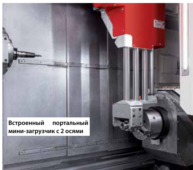
Встроенный портальный мини-загрузчик с 2 осями