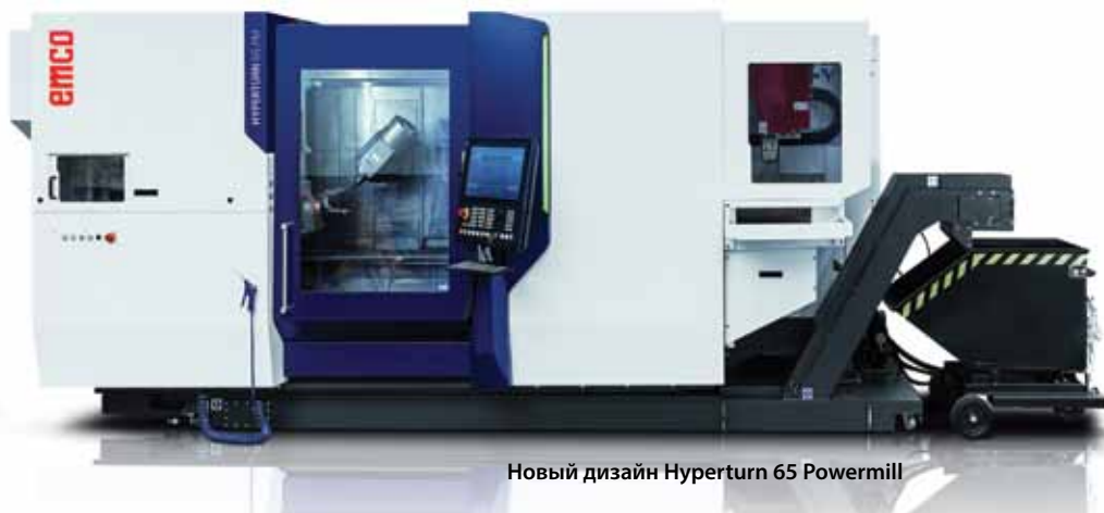
Новый дизайн Hyperturn 65 Powermill

В отличие от аналогичных моделей Hyperturn 65 Powermill имеет расстояние между шпинделями 1400 мм, что существенно увеличивает пространство для выполнения одновременной обработки на главном шпинделе и противо-