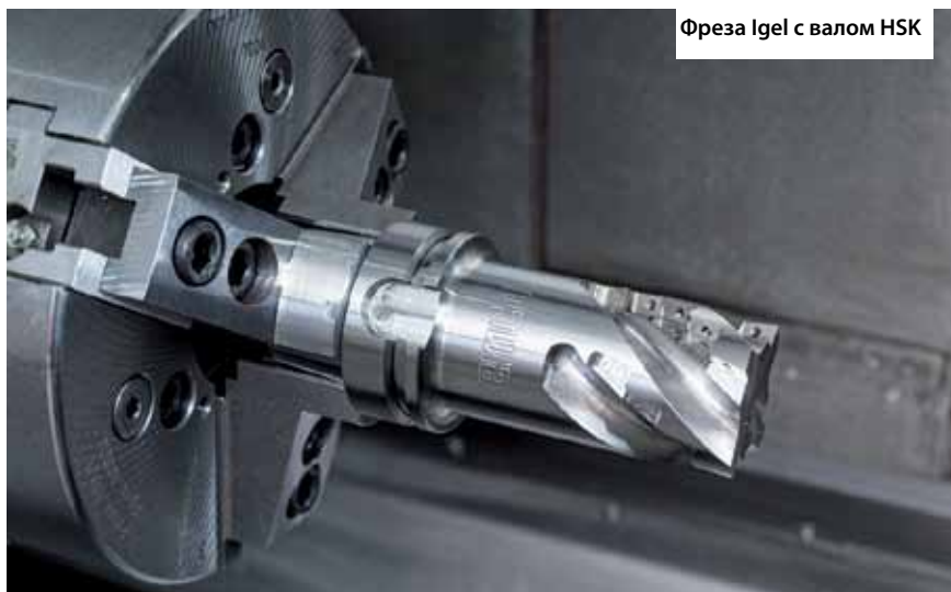
Фреза Igel с валом HSK

Использование 40-, 80- или 120-позиционного инструментального магазина с хвостовиком HSK-T63 открывает большие возможности для комплексной обработки сложных заготовок, снижает требования к переналадке при изготовлении индивидуальных деталей, а также гарантирует высокую стабильность токарных и фрезерных операций. Встроенный инструментальный магазин не требуется разбирать при транс-