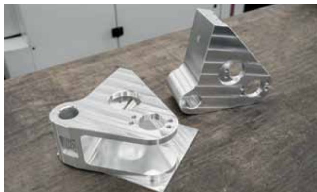
Небольшая часть ассортимента ответственных заготовок из стали St 52, CrNiMo 34, нержавеющей стали или алюминия; в данном случае это сложные в обработке детали шасси из стали St 52