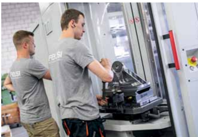
Удобная для оператора станция оснастки устройства смены палет PW 150

центры Hermle: «С одной стороны, мы накопили очень хороший опыт со станками Hermle, что касается точности, производительности, надежности, сервисного обслуживания и консультативных услуг. Кроме того, специалисты Hermle убедительно продемонстрировали нам возможности одновременного фрезерования по 5 осям, когда мы, например, получили специальный запрос на обработку сложных узлов рабочего колеса турбины. Мы провели интенсивный оценочный процесс, в результате которого конкуренты один за другим не справились с заданием и проиграли тендер. По причине жестких сроков Кристиан Симон (региональный руководитель по продажам на фирме Hermle AG в Швейцарии, CH-8212, г. Нойхаузен у Рейнского водопада) предоставил в наше распоряжение демонстрационный станок серии С 22 U, чтобы мы могли поставить заказчику в срок узлы рабочего колеса турбины требуемого качества. В результате мы получили заказ на комплектную обработку больших узлов рабочего колеса