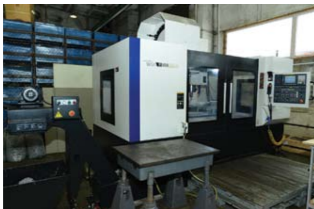
Станок HYUNDAI WIA F650 на производстве «Приборы ВОЛИКС»

В конце 2012 года перед предприятием встала задача модернизации существующего технопарка для изготовления