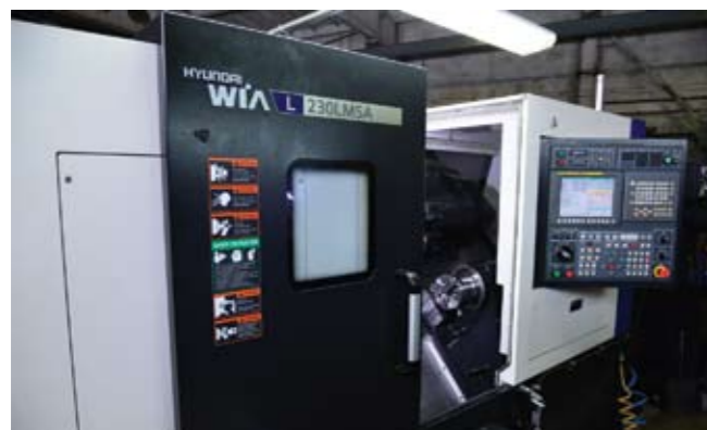
Станок HYUNDAI WIA L230LSMA на производстве компании «Приборы ВОЛИКС»